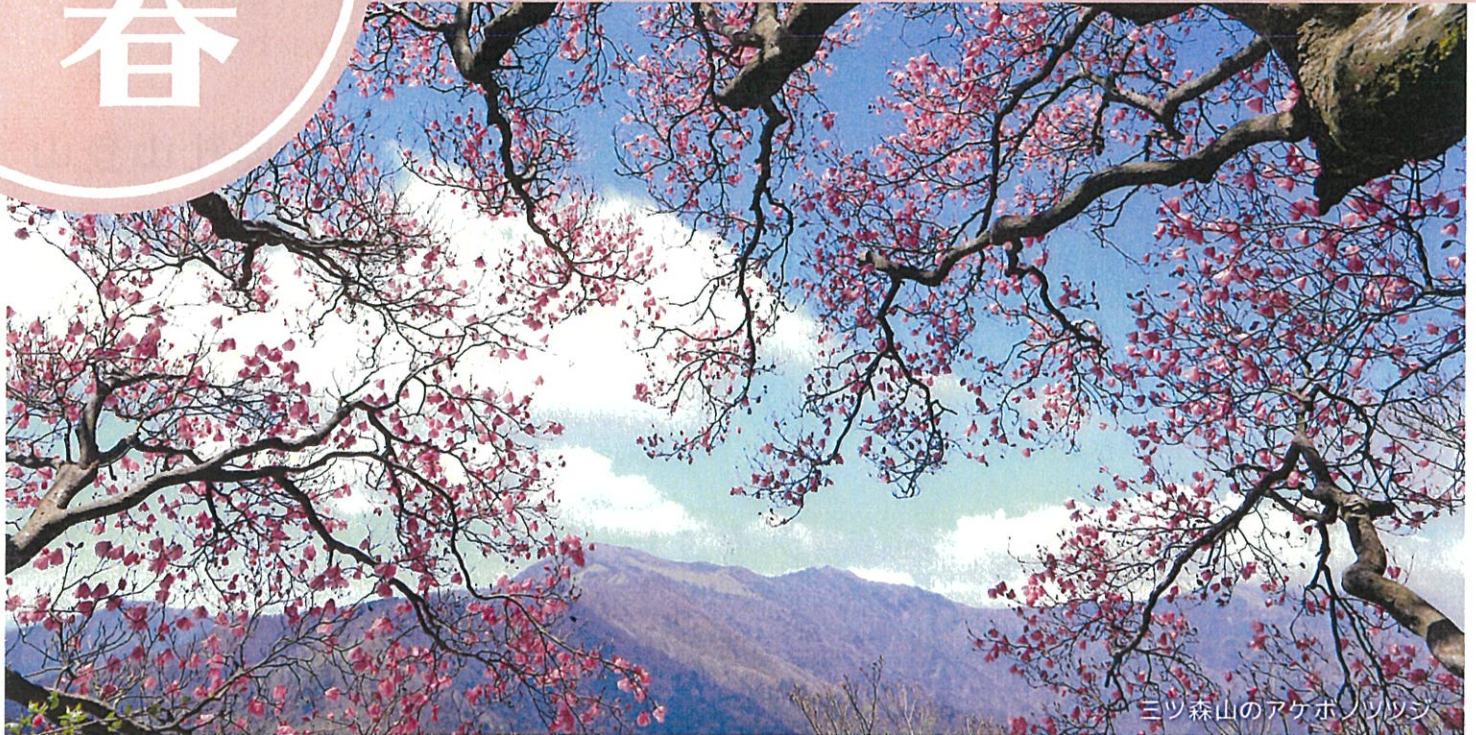
三ツ森山のアケボノツツジ